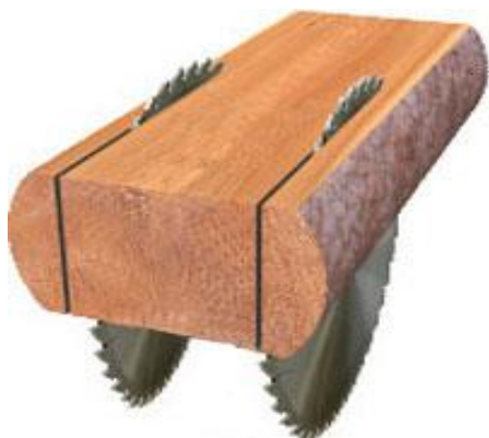
Схема распиловки лафета при производстве досок. На вал допускаются устанавливать до 7-ми пил (диаметр дисковой пилы до D=450 мм). Минимальная ширина доски – от 20 мм.

Схема распиловки при производстве четырехкантного бруса. Ширина между пилами регулируется комплектами проставок (размеры под заказ). Максимальные размеры бруса: высота до 150 мм, ширина до 300 мм.